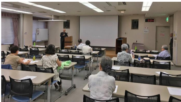
ビデオのひとつま