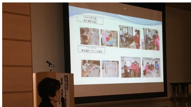
プレゼンテーションその2